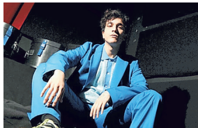
Il cantante Tananai

All'anagrafe si chiama Alberto Cotta Ramusino, ma per i suoi fan è, semplicemente, Tananai, parola che in dialetto bergamasco significa sciocco, sprovveduto, oggetto inutile. E per molto tempo si è sentito così. Poi, grazie a una terapia psicologica e ai giusti compagni di viaggio, il suo percorso di vita e professionale è cambiato. Fino a portarlo a questo tour nei palazzetti (prodotto da Friends and Partners, Magellano Concerti e Fastforwardlive), che domani toccherà il Palapartenope di via Barbagallo (ore 21, sold out). Dall'ultimo posto al Sanremo del 2022, con il brano "Sesso occasionale", alla hit del Sanremo 2023 che lo ha reso amatissimo dal grande