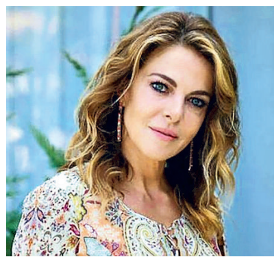
▲ Attrice Sopra, Claudia Gerini Nella foto in alto, Joe Satriani